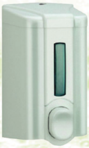
S2 500 ml