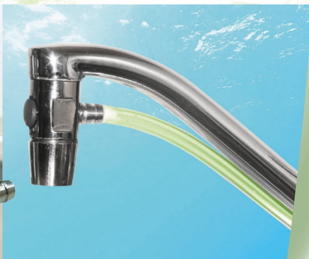
Csapra szerelhető vegyszeradagoló