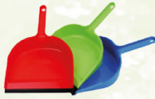
Műanyag szemeteslapát gumi éllel