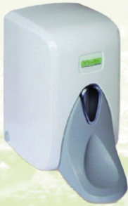
F6M 1000 ml