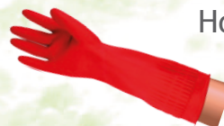
Hosszú szárú kesztyű