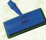
Terfir padtartó nyeles