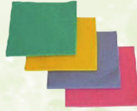
Mikroszálas törőkendő piros, kék, zöld, sárga