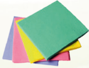
Vileda ipari törőkendő piros, kék, zöld, sárga